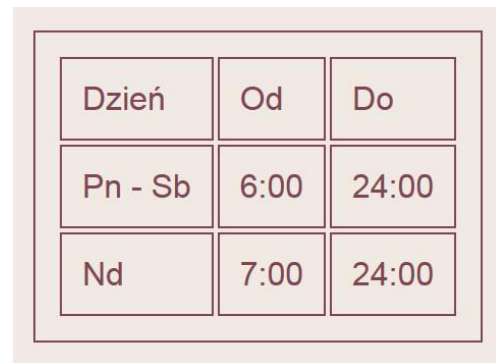
Obraz 2. Tabela z pliku stacja.html